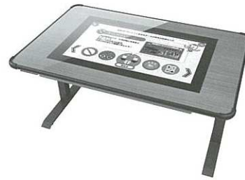
「元気はつらつトレパチ!テーブル」

なお同社の東京、名古屋、大阪、福岡の各ショールームには見本機が設置されており体験することが可能なほか、移動展示車による訪問デモも行なっている。