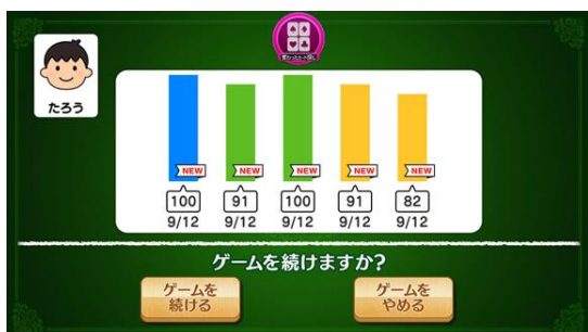
(続ける／やめる選択画面)