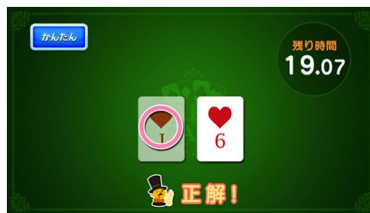
(変わったカードを選ぶ → 解答)