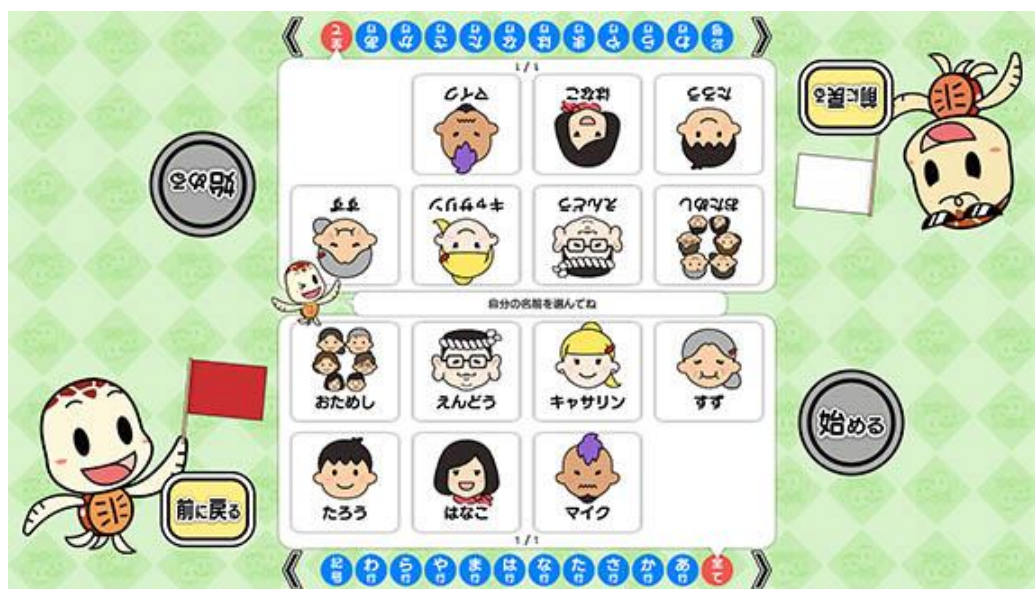
(ユーザー選択画面)

個人ユーザー名を選択することでプレイ履歴が保存されます。登録されていないユーザーは表示されませんので、プレイ履歴を保存したい場合は、予めユーザー登録することをお勧めします（ユーザー登録手順については「トレパチ！テーブル取扱説明書」をご参照下さい）。