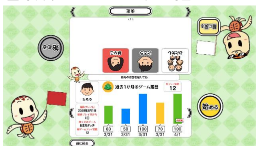
（ユーザー選択&プレイ履歴画面）