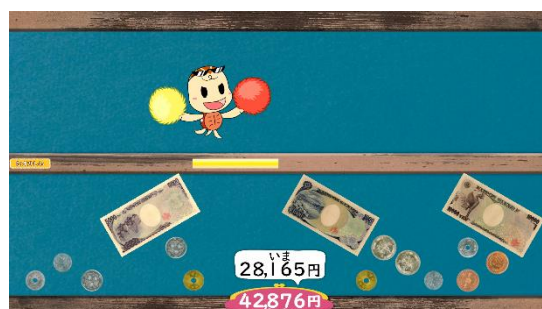
(ゲーム画面 難易度：むずかしい)