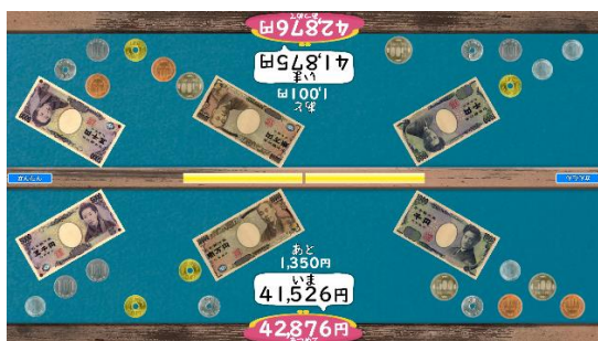
(2人プレイ時の画面)