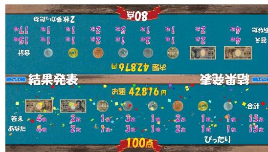
(2人プレイ時の結果発表画面)