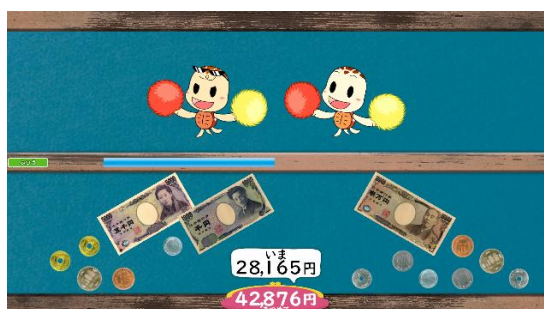
(ゲーム画面 難易度：ふつう)