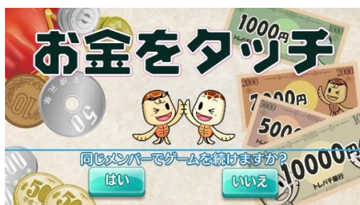
(続ける／やめる選択画面)