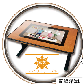
記録媒体に履歴データを出力