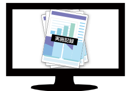
パソコンで帳票化