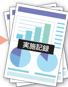
パソコンで帳票化