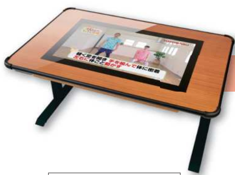
記録媒体に履歴データを出力