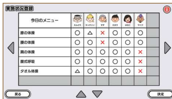
「元気はつらつ!らくちん体操」