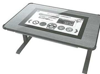
「元気はつらつトレパチ!テーブル」

なお同社の東京、名古屋、大阪、福岡の各ショールームには見本機が設置されており体験することが可能なほか、移動展示車による訪問デモも行なっている。